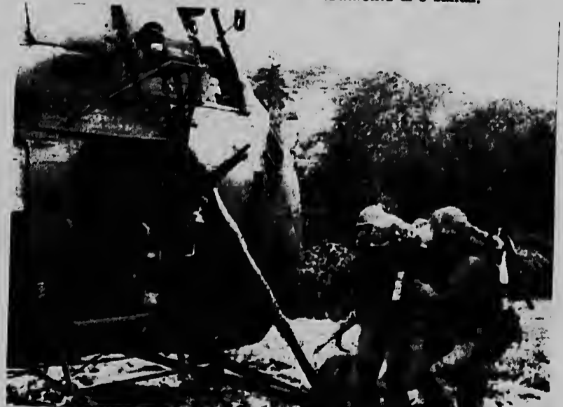
Asi competronan di un grupo di marina norteamericano serid. ta ser hinka den un helicopter qu ta wardando riba dje pa hibe un centro medico asistencial. E accion aki a tuma lugar durante "Operation Dekhouse" siman pasá na Vietnam durante cual Merca a sufri e perdidan di mas fuerte den e tempu qu nan ta na Viet Nam.